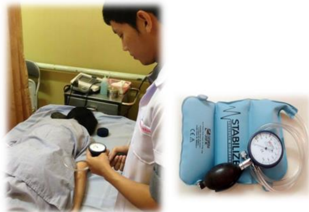
Figure 3. Pressure biofeedback unit and testing position for abdominal muscle strength.

กล้ามเนื้อหน้าท้อง (draw-in) เป็นเวลา 10 วินาที โดยพยายามป้องกันการเคลื่อนไหวเชิงกรานหรือสะโพก ทดสอบซ้ำ 3 ครั้ง บันทึกค่าความดันในถุงลมที่เปลี่ยนแปลง โดยทั่วไปค่าความสามารถในการทำงานของกล้ามเนื้อ transversus abdominis ที่เหมาะสมควรมีค่าความดันลดลงอยู่ระหว่าง 4 ถึง 10 มิลลิเมตรปรอท 15, 17 (Figure 3)