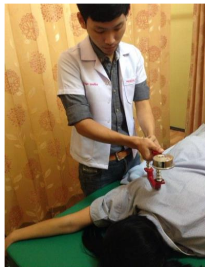
Figure 6. Lower trapezius muscle strength evaluated with a HHD.

ผู้ป่วยนอนคว่ำยกแขน 140 องศา จากนั้นให้ผู้ป่วยพยายามดันไหล่ลงพร้อมกับหุบแขนเข้าทำให้เกิดการหุบกระดูกสะบักเข้าด้านในและลงด้านล่าง (scapular adduction และ depression) ออกแรงต้าน HHD ให้ได้มากที่สุด ขณะที่ผู้ทดสอบให้แรงต้านผ่าน HHD ซึ่งวางไว้บริเวณ spine ของกระดูกสะบัก (บริเวณกึ่งกลางระหว่าง acromial process กับ the root ของ spine ของกระดูกสะบัก) 19 (Figure 6)