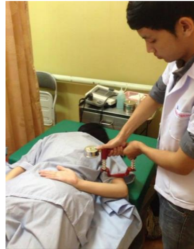
Figure 8. Rhomboid muscles strength evaluated with a HHD.

ผู้ป่วยอยู่ในท่านอนคว่ำ แขนไขว้หลัง จากนั้นให้ผู้ป่วยพยายามดึงกระดูกสะบักไปด้านหลังและหมุนลงทางด้านล่าง (scapular retraction และ downward rotation) ออกแรงต้าน HHD ให้ได้มากที่สุด ขณะที่ผู้ทดสอบให้แรงต้านผ่าน HHD ที่กระดูกต้นแขนบริเวณกึ่งกลางระหว่าง acromion process กับ lateral epicondyle ของกระดูกต้นแขน 19 (Figure 8)