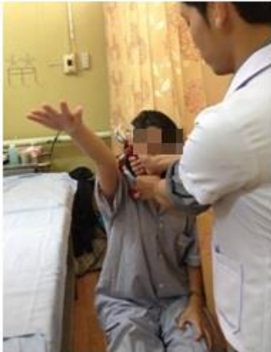
Figure 7. Serratus anterior muscle strength evaluated with a HHD.

ผู้ป่วยอยู่ในท่านั่ง ยกแขน 130 องศา จากนั้นให้ผู้ป่วยพยายามเคลื่อนกระดูกสะบักไปทางด้านหน้า (scapular upward rotation ร่วมกับ protraction) ออกแรงต้าน HHD ให้ได้มากที่สุด ขณะที่ผู้ทดสอบให้แรงต้านผ่าน HHD ซึ่งวางไว้บริเวณกระดูกต้นแขนล่างต่อจุดเกาะปลายของกล้ามเนื้อ deltoid 19 (Figure 7)