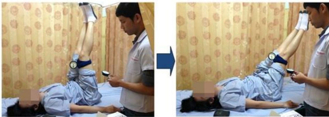
Figure 2. Double leg lowering test (DLLT): Starting position and participant slowly lower both legs down to the table.

1. การทดสอบลดระดับขาสองด้านลง (Double leg lowering test; DLLT) เป็นวิธีทดสอบความแข็งแรงของกล้ามเนื้อหน้าท้องชนิดหนึ่ง ทำเริ่มต้นให้ผู้ปวยนอนหงายโดยกอดอกด้วยแขนสองข้าง และติด inclinometer ไว้เหนือเข่าด้านขวา ผู้ทดสอบบอกให้ผู้ปวยงอสะโพก 90 องศาพร้อมกับข้อเข่าเหยียดทั้งสองด้าน ผู้ทดสอบปรับความดันในถุงลม pressure biofeedback unit (PBU) ที่วางไว้ใต้กระดูกสันหลังบริเวณเอว