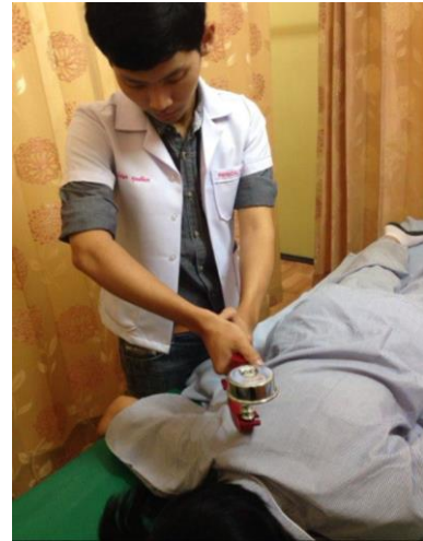
Figure 5. Middle trapezius muscle strength evaluated with a HHD.

ผู้ป่วยนอนคว่ำ กางข้อไหล่ 90 องศา ร่วมกับงอศอก 90 องศา จากนั้นให้ผู้ป่วยพยายามดึงกระดูกสะบักไปด้านหลัง (scapular retraction) ออกแรงต้านกับ HHD ให้ได้มากที่สุด ขณะที่ผู้ทดสอบให้แรงต้านผ่าน HHD ซึ่งวางไว้บริเวณ spine ของกระดูกสะบัก (บริเวณกึ่งกลางระหว่าง acromial process กับ root ของ spine ของกระดูกสะบัก) 19 (Figure 5)