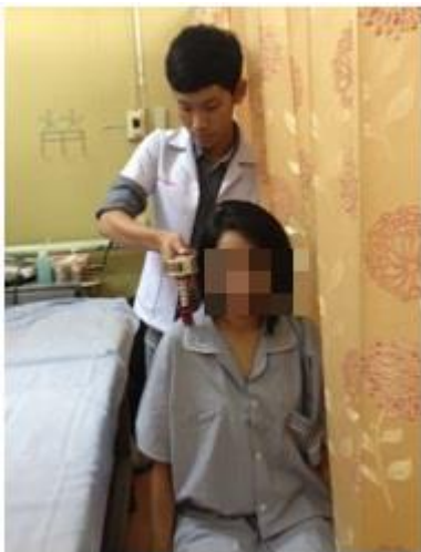
Figure 4. Upper trapezius muscle strength evaluated with a HHD.

ผู้ป่วยอยู่ในท่านั่ง แขนสองข้างวางไว้ข้างลำตัว จากนั้นให้ผู้ป่วยพยายามยกกระดูกสะบักขึ้นทางด้านบน หรือ การยกไหล่ (scapular elevation) ออกแรงต้าน HHD ให้ได้มากที่สุด ขณะที่ผู้ทดสอบให้แรงต้านผ่าน HHD ซึ่งวางไว้บริเวณกึ่งกลางระหว่าง mastoid process กับ lateral acromion 19 (Figure 4)