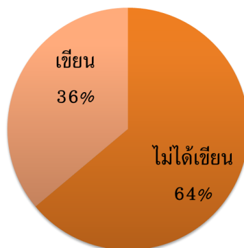
ภาพที่ 3 สัดส่วนผู้เขียนผลงานวิชาการในปี พ.ศ.2558

เมื่อศึกษาถึงสัดส่วนของผู้เขียนบทความวิชาการในปี พ.ศ.2558 หลังจากที่ได้มีนโยบายและส่งเสริมและสนับสนุนแล้ว พบว่า ประมาณกว่าครึ่งหนึ่งของตัวอย่าง (ร้อยละ 64) ไม่ได้มีการเขียนผลงานวิชาการ (ภาพที่ 2) และมีเพียงส่วนน้อย (ร้อยละ 36) มีการเขียนผลงานวิชาการ